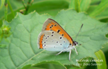
Močvirski cekinček