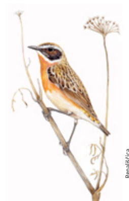
Repaljčica ilustracija: Dan Meseček

Vstop s kolesom v rezervat ni dovoljen. Kolesa lahko priklenete na stojalo ob vstopni točki.