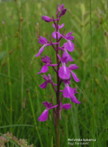
Močvirska kukavica