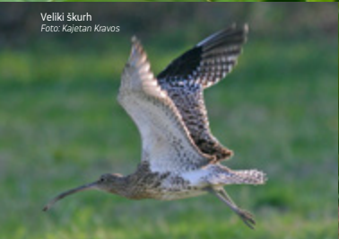
Veliki škurh