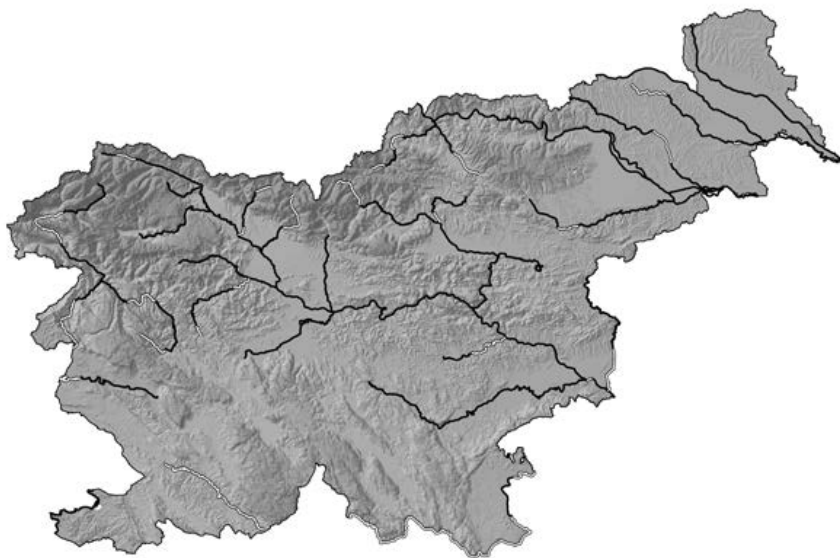
Slika 1: Popisni odseki januarskega štetja vodnih ptic (IWC) na rekah in obalnem morju v Sloveniji leta 2016; črne črte označujejo popisane, bele pa nepopisane odseke.